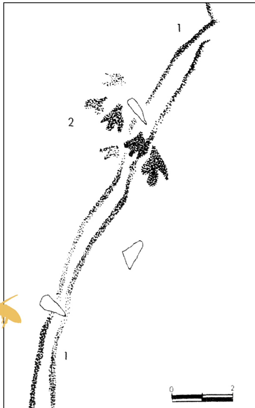
Abrigo del Ciervo, Barranco de las letras, DOS AGUAS

Interpretació: Abelles al voltant d'un forat i cordes amb algún glaó per accedir al niu.