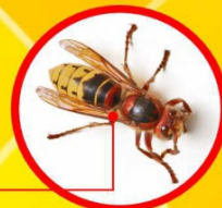
Avispón Autóctono ( Vespa crabro )

No confundir con el Avispón Autóctono o Europeo ( Vespa crabro ).