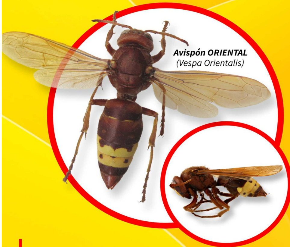
Avispón ORIENTAL ( Vespa Orientalis )