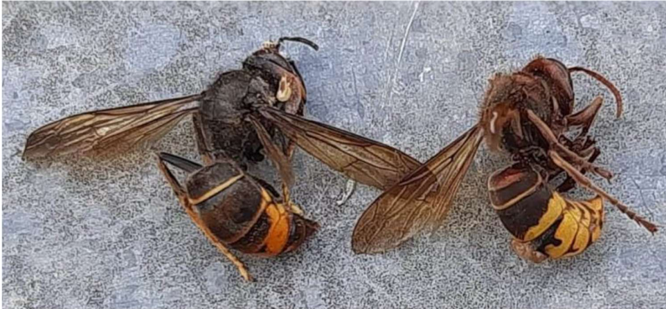
Izquierda: Vespa velutina . Derecha: Vespa crabro .